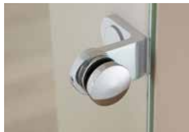
Punkthalter: Edition Style Edelstahl Chrom Glanz poliert