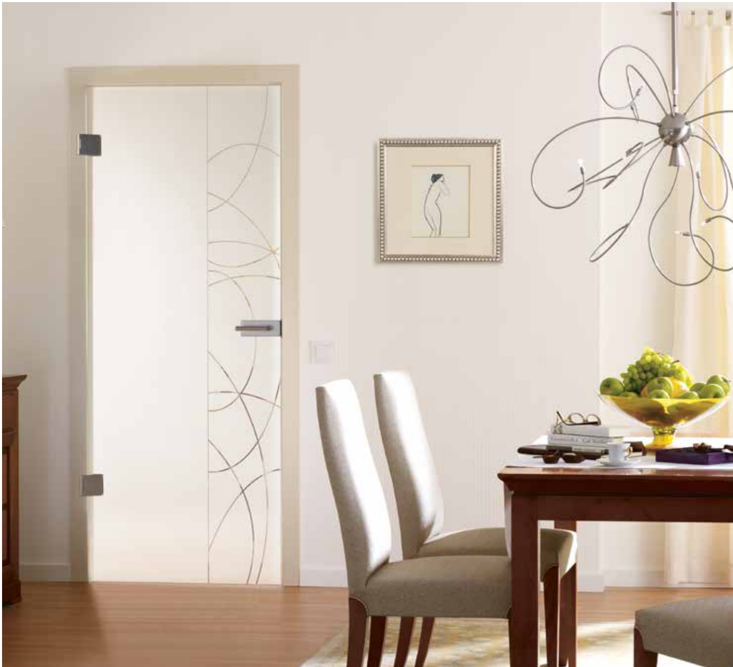
Drehtür 1-flg. | Glasdesign: Ambiente, Motiv klar/Fläche matt, auch als Glasschiebetür | Beschlagset: Square 2.0, ähnl. Edelstahl matt