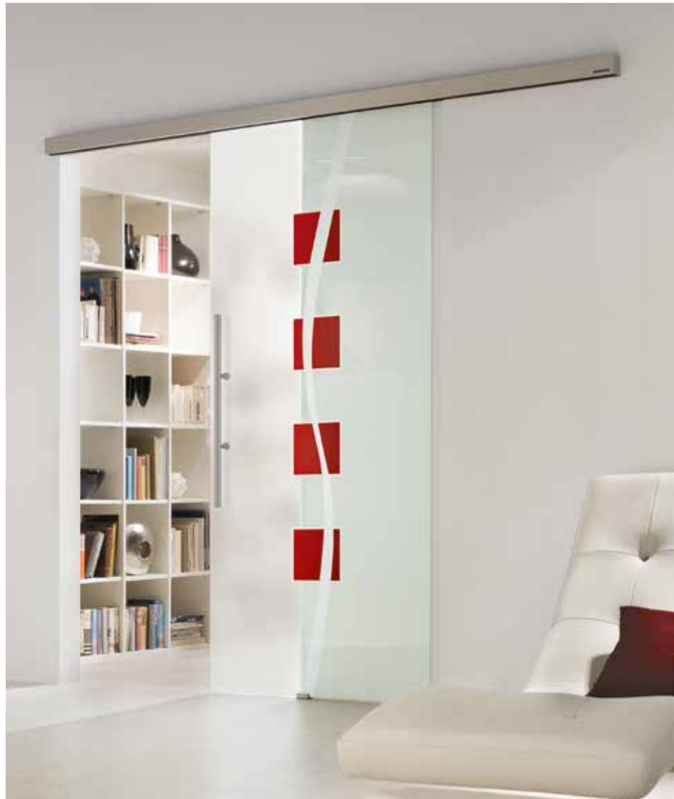
Schiebesystem 1-flg.: Tvin 2.0, ähnl. Edelstahl matt | Glasdesign: Nivada, Farbblackierung auf Satinato Griffstange: L&H G 700, ähnl. Edelstahl matt