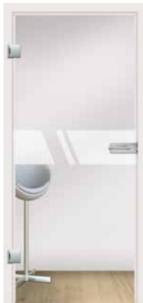
Aero, Motiv matt / Fläche klar auch als VSG-Tür