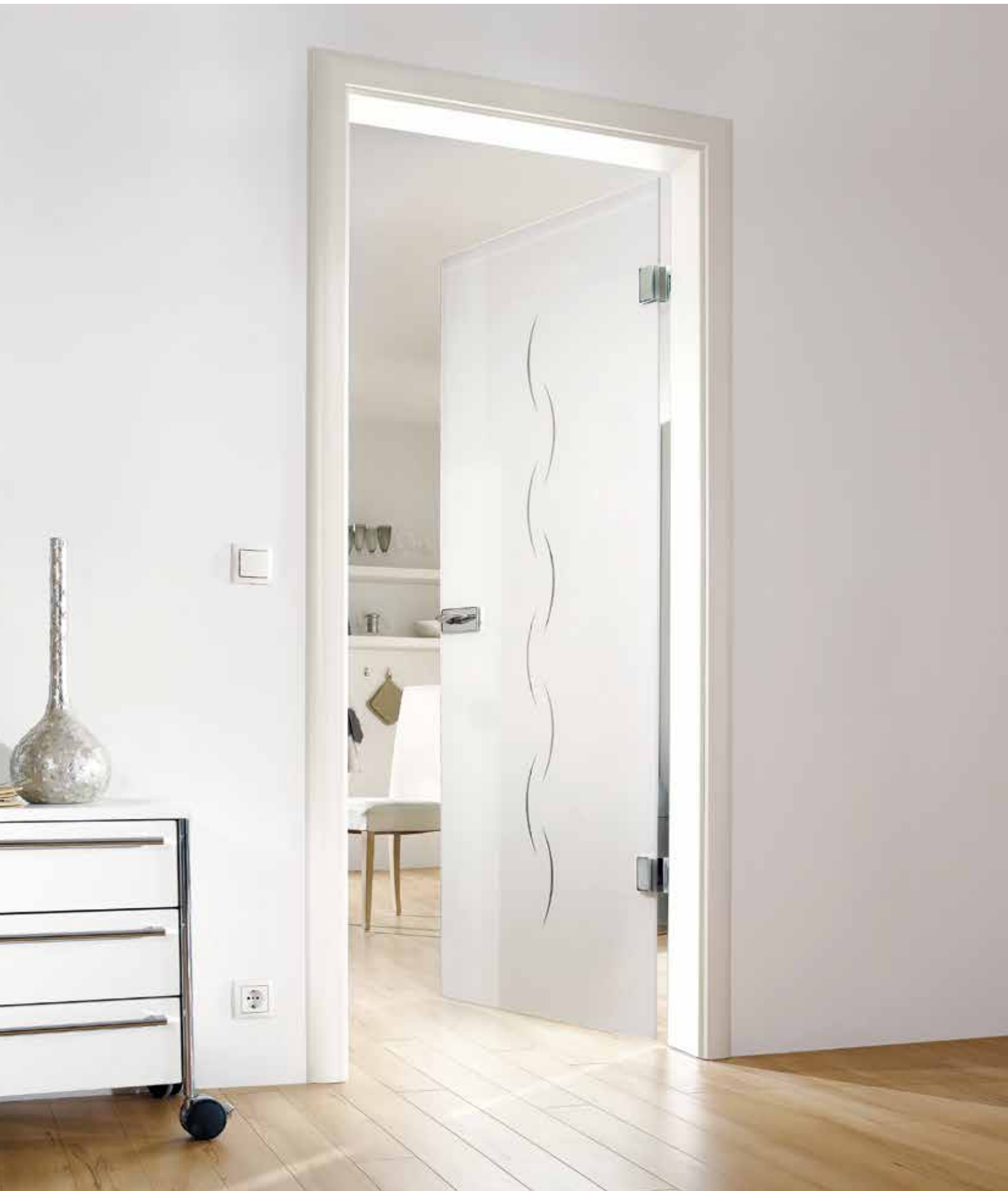
Drehtür 1-fig. | Glasdesign: Alinea, Motiv klar/Fläche matt, auch als Glasschiebetür und VSG-Tür | Beschlagset: Square 2.0, ähnl. Chrom Glanz