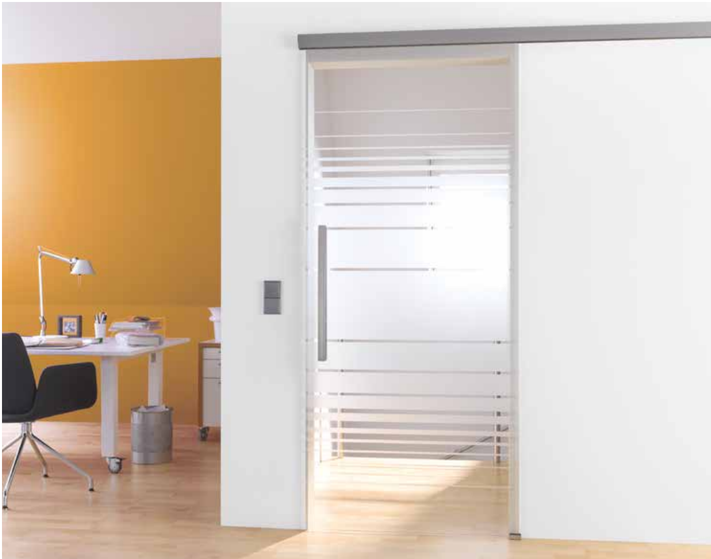
Schiebesystem 1-fig.: Tvin 2.0 Convex, ähnl. Edelstahl matt | Glasdesign: Struktura Typ 8, Motiv matt / Fläche klar | L&H Griffleiste beidseitig, 600 mm, ähnl. Edelstahl matt