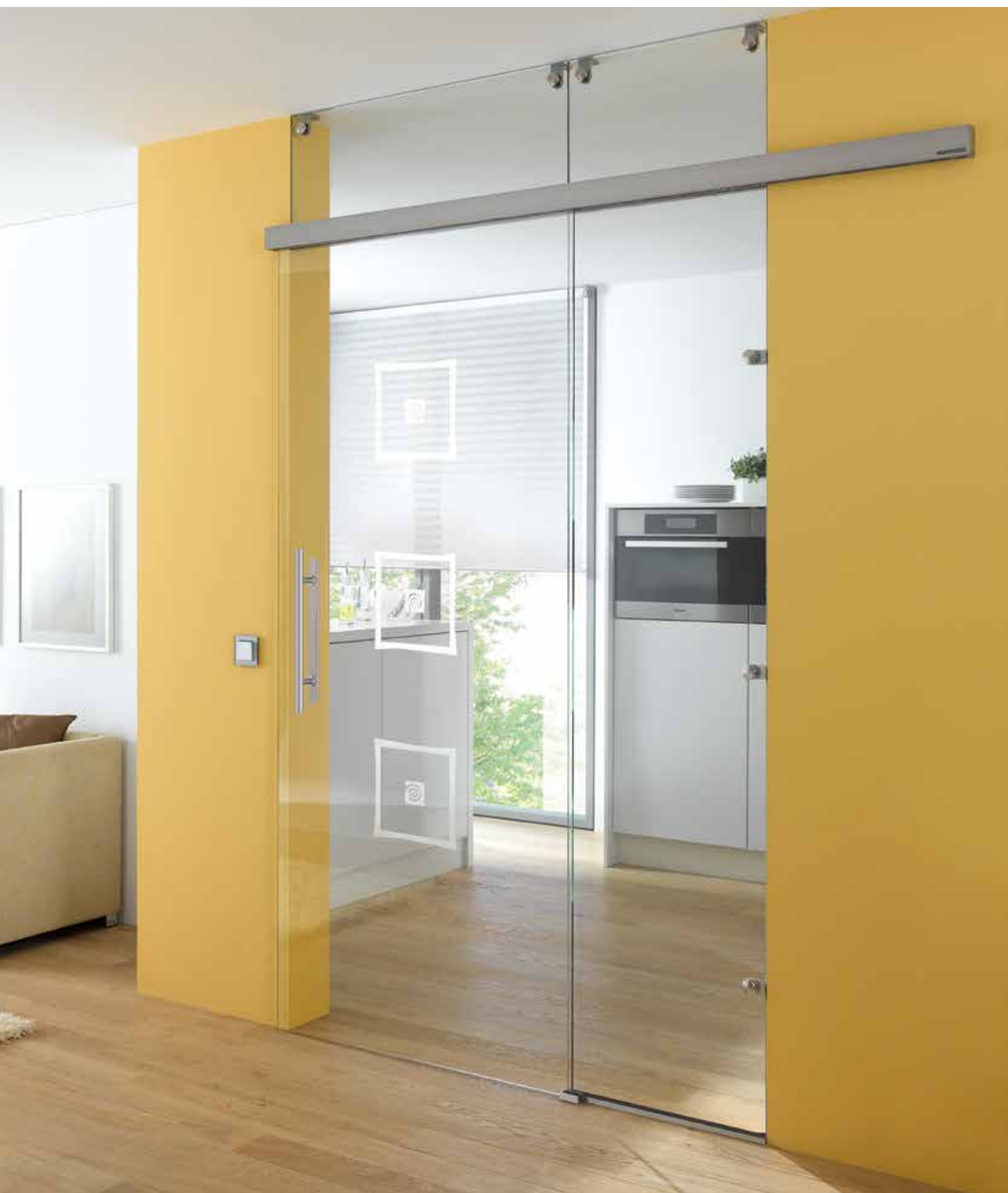
Glasschiebeanlage Typ 1 | Schiebesystem: Tvin 2.0/120, ähnl. Edelstahl matt, Seitenteil und Oberlicht: Float hell | Glasdesign: Alana, Motiv matt/Fläche klar Griffstange: L&H G 420 rund, Griffleiste einseitig, Edelstahl matt