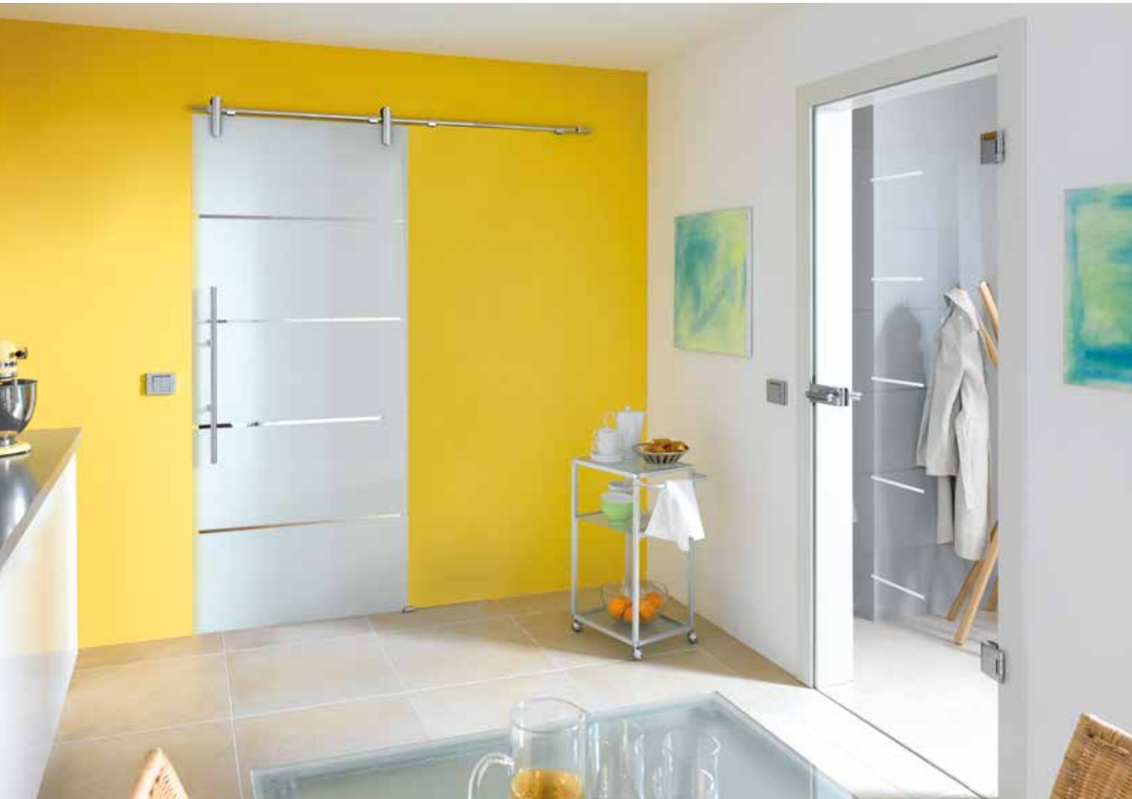
Modell links: Schiebesystem 1-fig.: Edition Style, Edelstahl Chrom Glanz poliert | Glasdesign: Atos, Streifen klar/Fläche matt | Griffstange: L&H G 700 rund, Edelstahl Chrom Glanz poliert Modell rechts: Drehtür 1-fig. | Glasdesign: Modus, Motiv matt/Fläche klar, auch als Glasschiebetür und VSG-Tür | Beschlagset: Pure 2.0., ähnl. Chrom Glanz