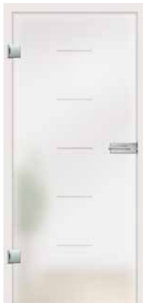
Modus, Motiv klar/Fläche matt auch als VSG-Tür