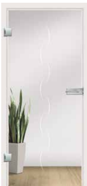
Alinea, Motiv matt / Fläche klar auch als Glasschiebetür und VSG-Tür