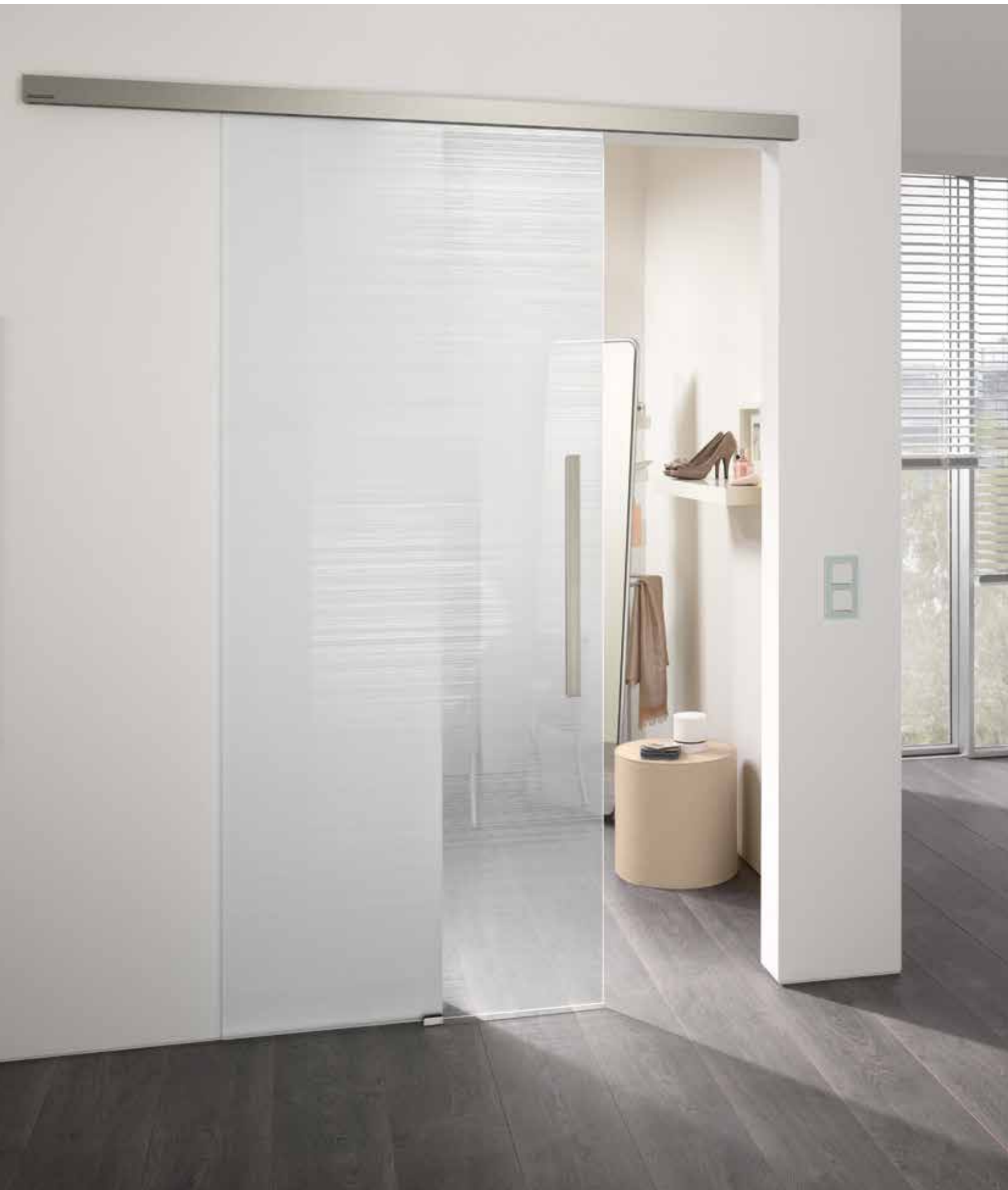
Schiebesystem 1-flg.: Tvin 2.0, ähnl. Edelstahl matt | Glasdesign: Corteo | L&H Griffleiste beidseitig, 600 mm, ähnl. Edelstahl matt