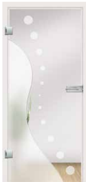
Feng Shui Typ 5, V-Rillenschliff poliert mit Satinierung auf Float hell