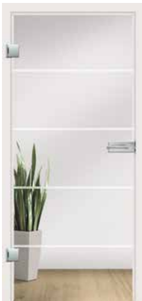
Atos, Streifen matt/Fläche klar auch als Glasschiebetür und VSG-Tür