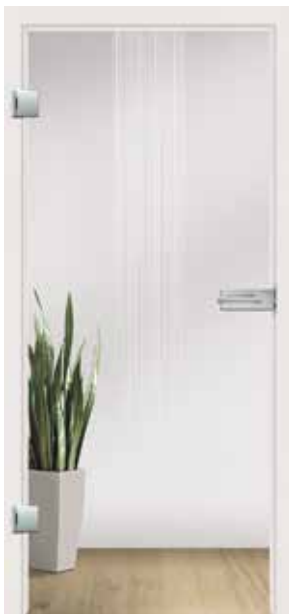
Flow, Motiv matt / Fläche klar auch als Glasschiebetür