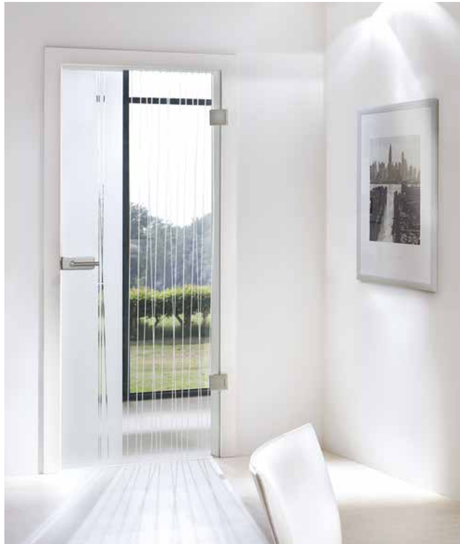
Drehtür 1-flg. | Glasdesign: Stream Typ 1, Motiv matt/Fläche klar, auch als Glasschiebetür und VSG-Tür Beschlagset: Square 2.0, ähnl. Edelstahl matt