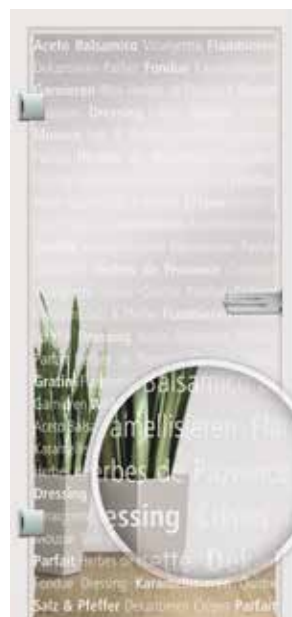
Culinaria, Schrift weiß / Fläche klar auch als Glasschiebetür und VSG-Tür