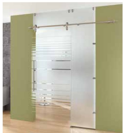
Glasschiebeanlage Typ 1 | Schiebesystem: Edition Basic, Edelstahl matt, Seitenteil und Oberlicht: Satinato Glasdesign: Struktura Typ 8, Motiv matt / Fläche klar Griffstange: L&H G 700 rund, Edelstahl matt

Alle Beschläge wie auch die Glasdesigns sind untereinander kombinierbar.