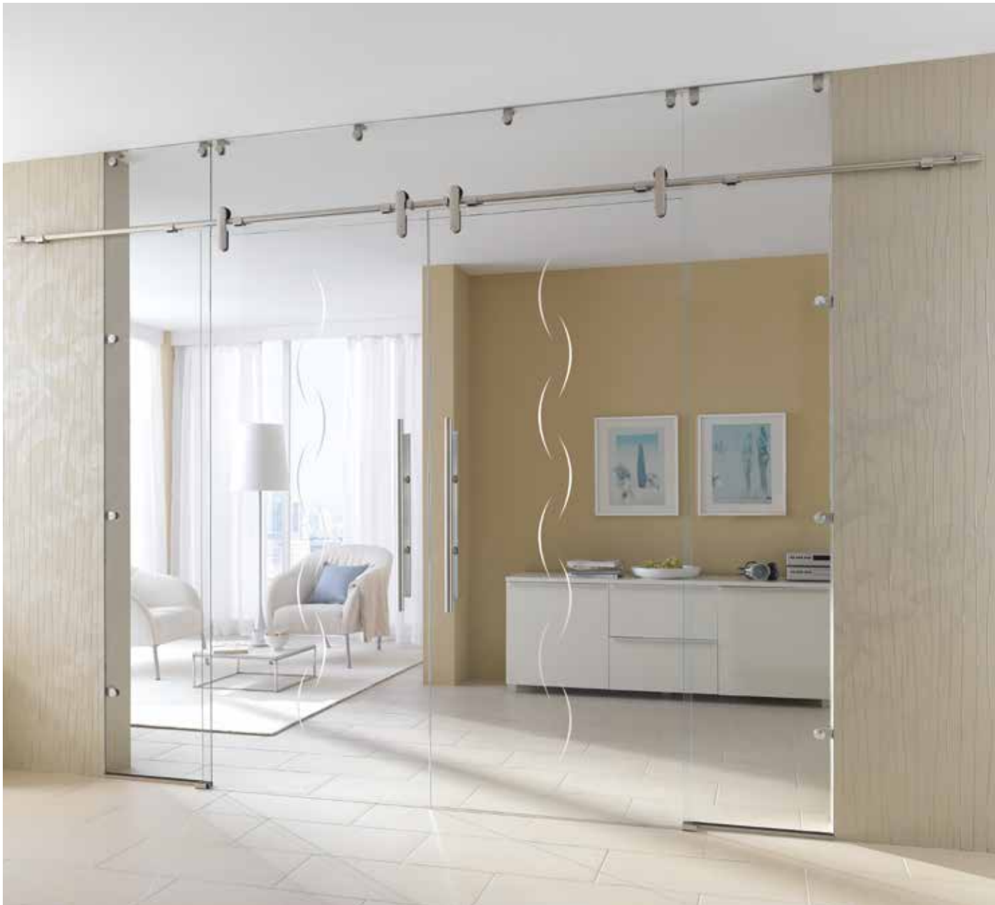
Glasschiebeanlage Typ 3 | Schiebeseystem: Edition Style, Edelstahl matt, Seitenteil und Oberlicht: Float hell | Glasdesign: Alinea, Motiv matt/Fläche klar Griffstangen: L&H G 700 rund, Griffleiste einseitig, Edelstahl matt