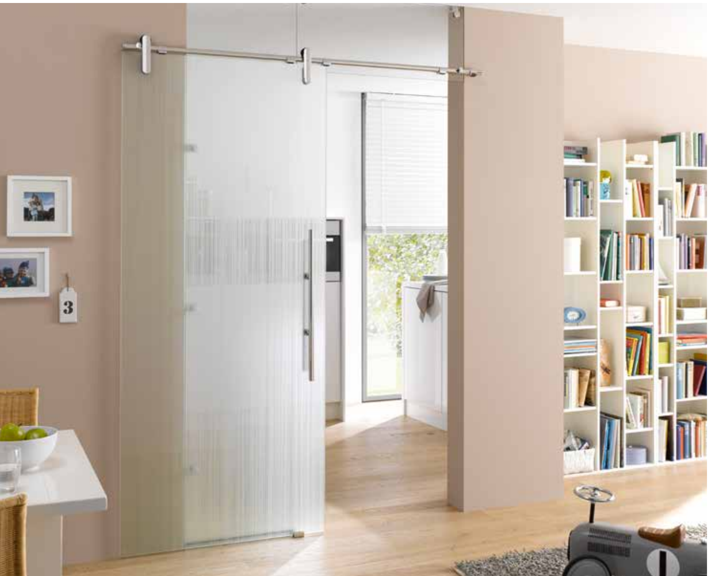
Glasschiebeanlage Typ 1 | Schiebesystem: Edition Style, Edelstahl Chrom Glanz poliert, Seitenteil und Oberlicht: Float hell | Glasdesign: Lista Due, Motiv beidseitig satiniert, 3D-Optik | Griffstange: L&H G 700 rund, Griffleiste einseitig, Edelstahl Chrom Glanz poliert