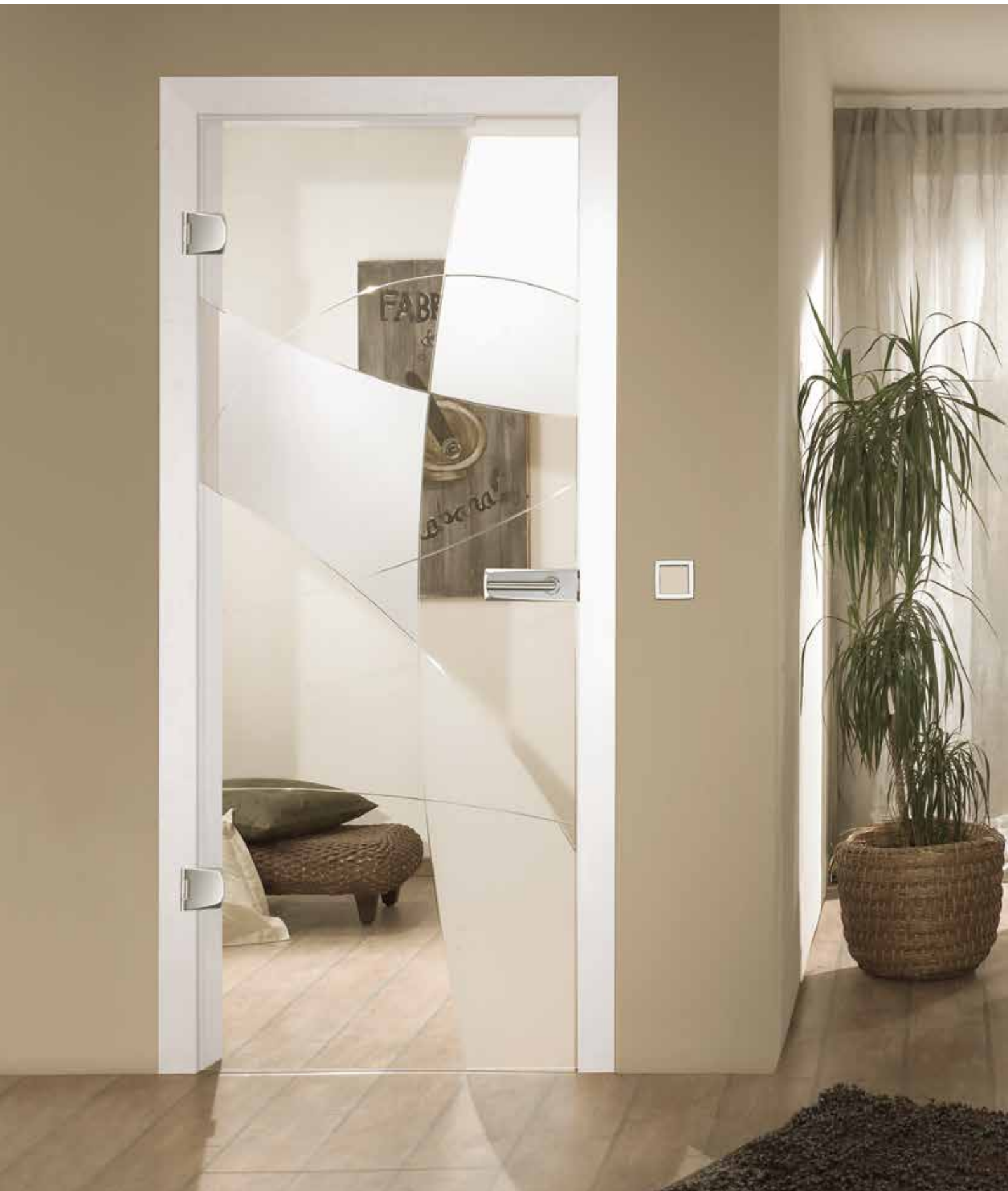
Drehtür 1-flg. | Glasdesign: Nubia, V-Rillenschliff poliert mit Satinierung auf Float hell, auch als Glasschiebetür | Beschlagset: Bacio 2.0, Chrom satiniert