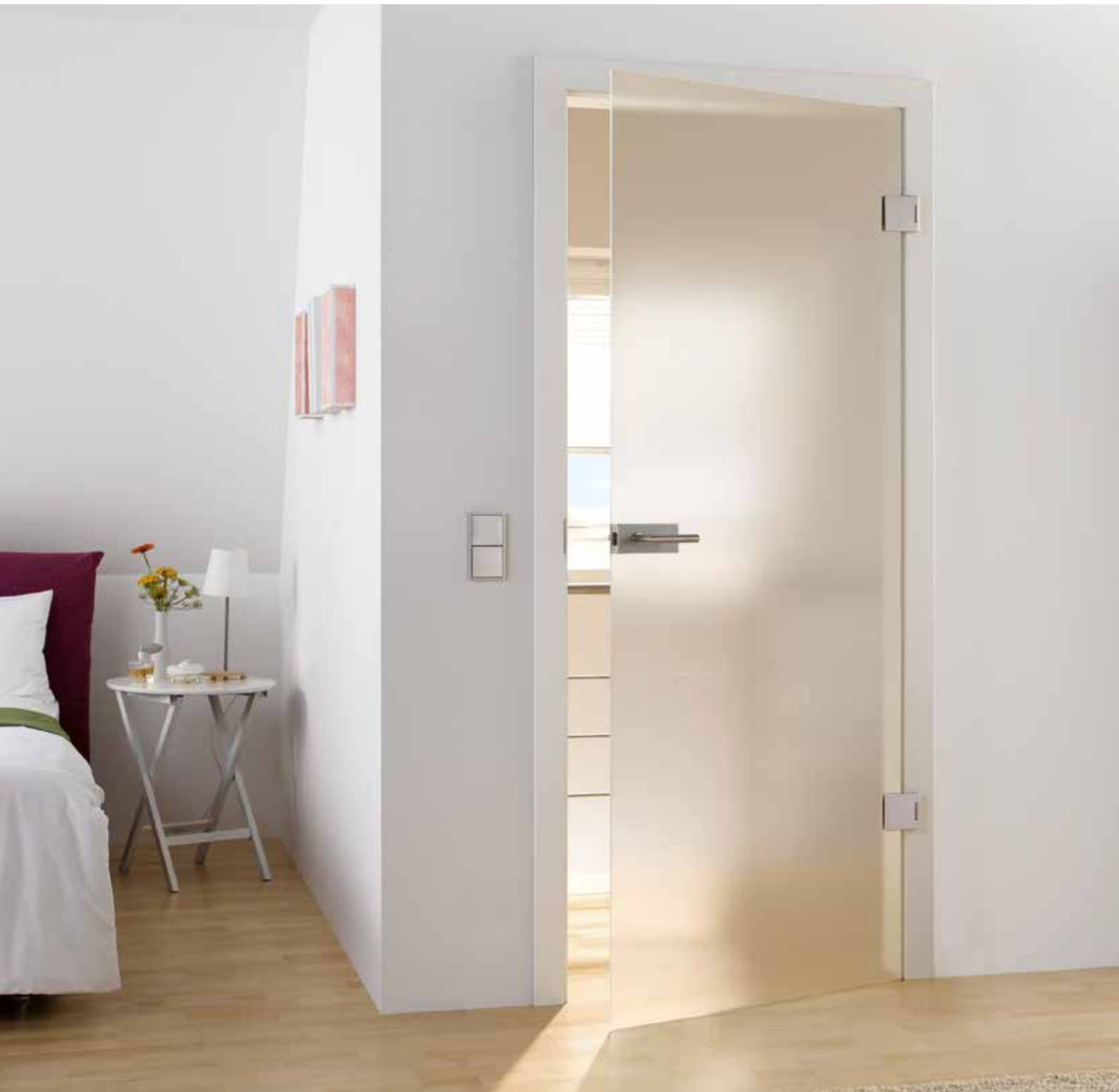
Drehtür 1-flg. | Glasdesign: Modena, auch als Glasschiebetür | Beschlagset: Square 2.0, ähnl. Edelstahl matt