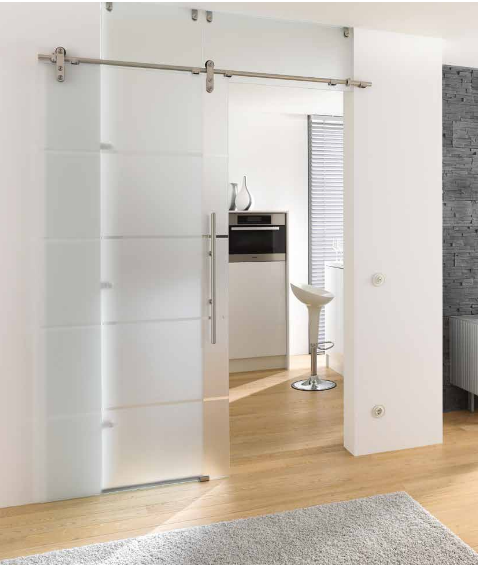
Glasschiebeanlage Typ 1 | Schiebesystem: Edition Basic, Edelstahl matt, Seitenteil und Oberlicht: Satinato | Glasdesign: Atos, Streifen klar/Fläche matt Griffstange: L&H G 700 rund, Edelstahl matt