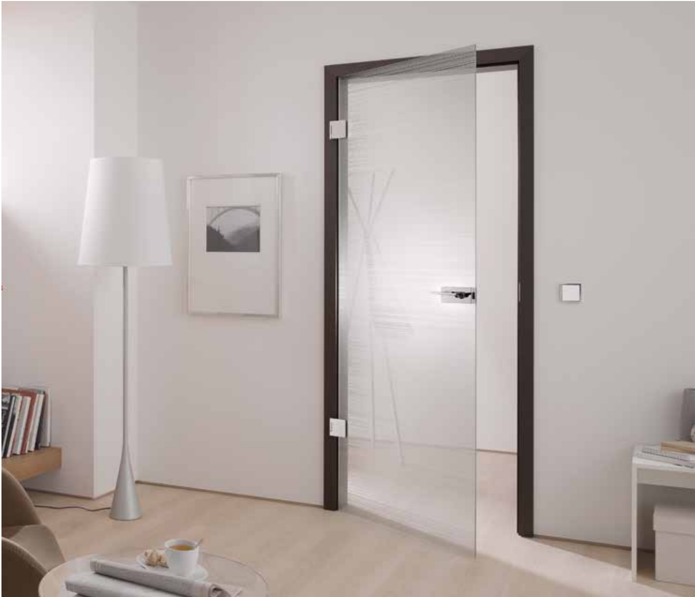
Drehtür 1-flg. | Glasdesign: Corteo | Beschlagset: Square 2.0, ähnl. Chrom Glanz