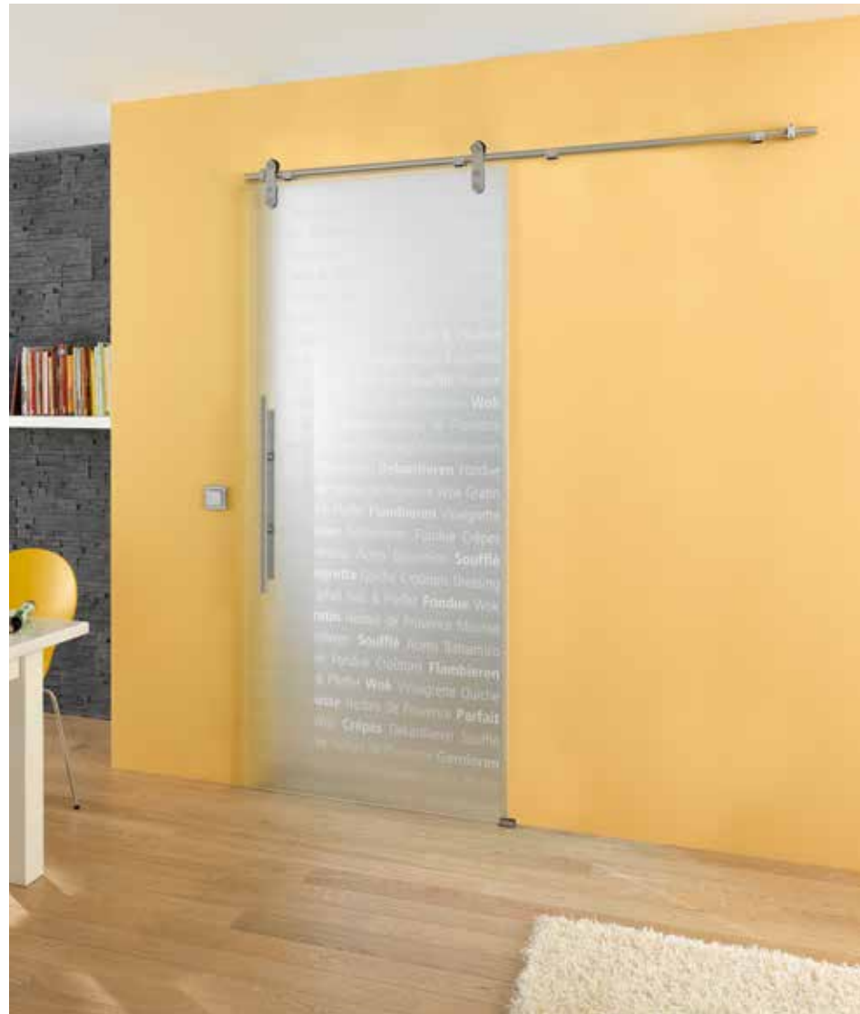
Schiebesystem 1-flg.: Edition Basic, Edelstahl matt | Glasdesign: Culinaria, Schrift weiß/Fläche matt Griffstange: L&H G 700 rund, Griffleiste einseitig, Edelstahl matt