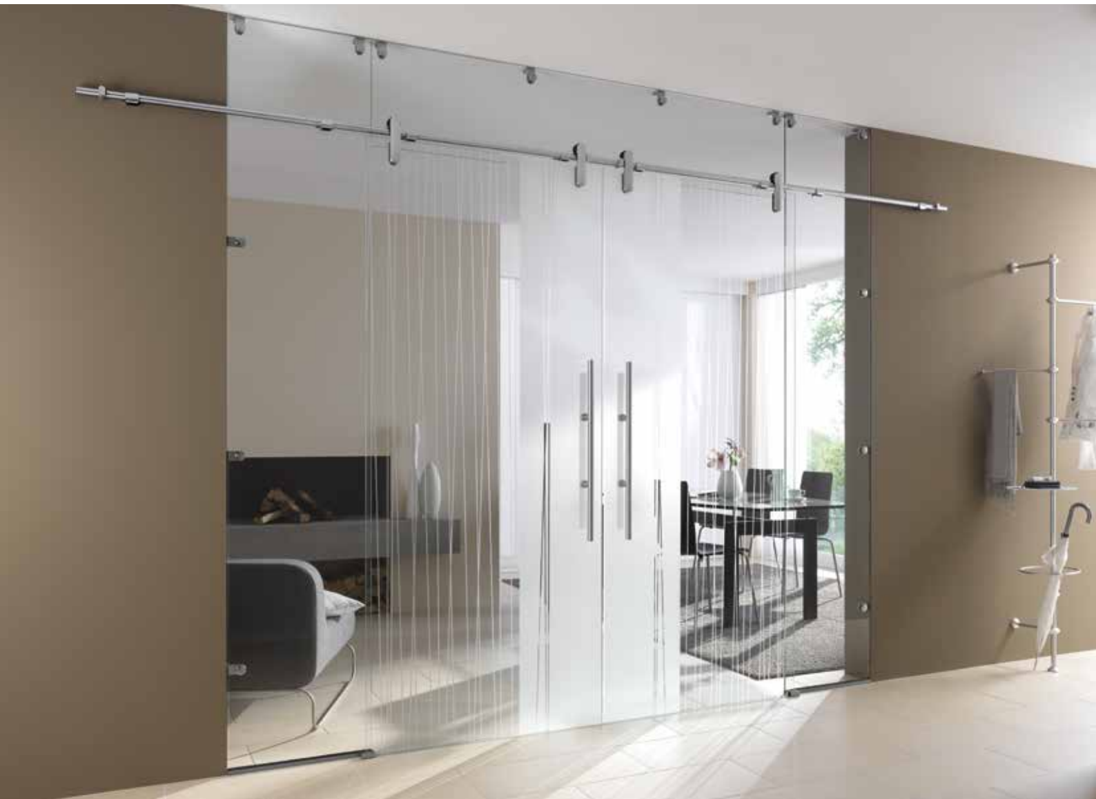
Glasschiebeanlage Typ 3 | Schiebesystem: Edition Style, Edelstahl Chrom Glanz poliert, Seitenteil und Oberlicht: Float hell | Glasdesign: Stream Typ 1, Motiv matt/Fläche klar Griffstangen: L&H G 700 rund, Griffleiste einseitig, Edelstahl Chrom Glanz poliert