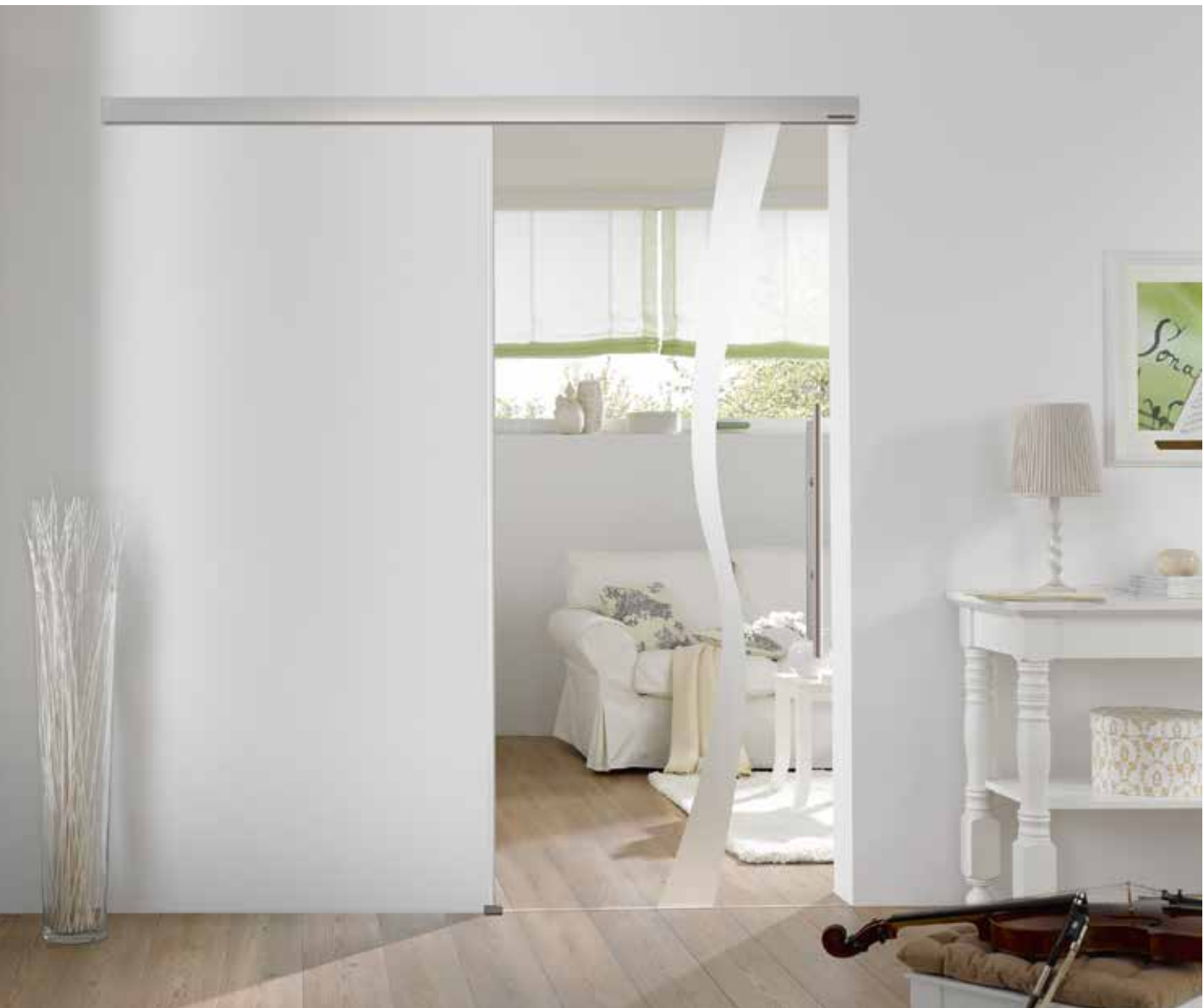
Schiebesystem 1-flg.: Tvin 2.0, ähnl. Edelstahl matt | Glasdesign: Wave Typ 8, Motiv matt/Fläche klar | Griffstange: L&H G 700 rund, Griffleiste einseitig, Edelstahl matt