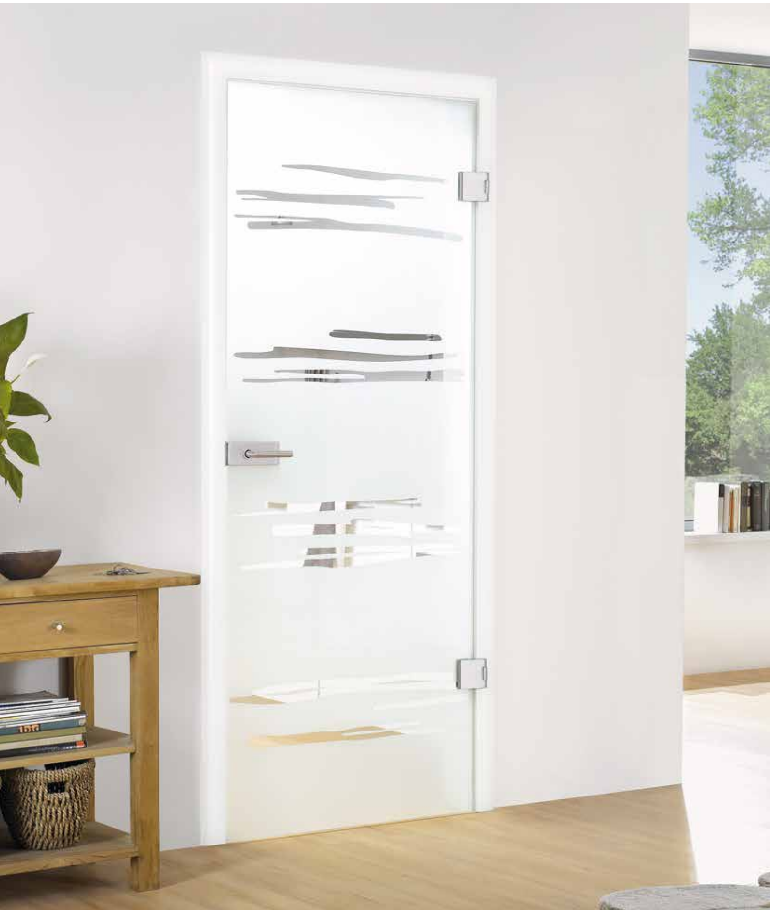
Drehtür 1-flg. | Glasdesign: Gemini, Motiv klar/Fläche matt, auch als Glasschiebetür und VSG-Tür | Beschlagset: Pure 2.0, Chrom satiniert