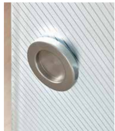
Glasdesign: Lucido | Griffmuschel: L&H M 70, ähnl. Edelstahl matt