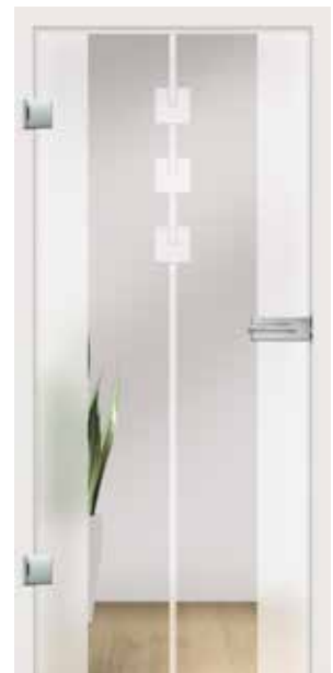
Viva Typ 3, Motiv matt/Fläche klar