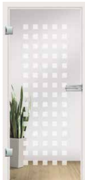
Carre, Motiv matt/Fläche klar