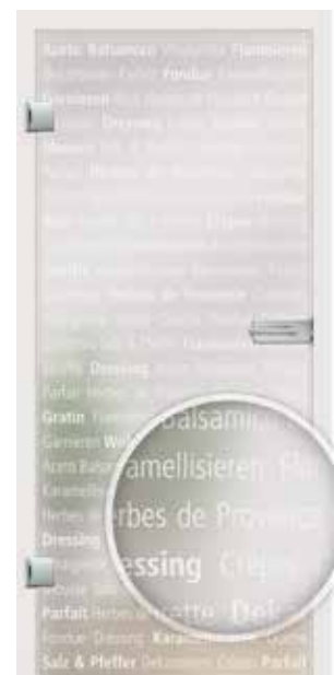
Culinaria, Schrift weiß / Fläche matt auch als Glasschiebetür und VSG-Tür