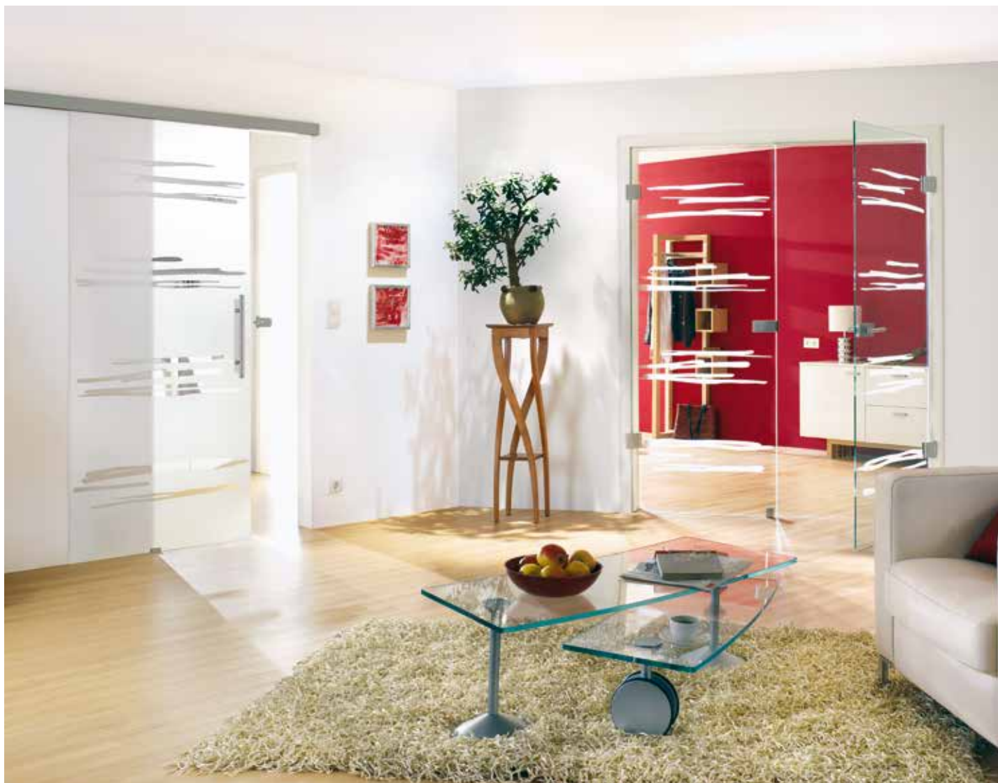
Modell links: Schiebesystem 1-flg.: Tvin 2.0, ähnl. Edelstahl matt | Glasdesign: Gemini, Motiv klar/Fläche matt | Griffstange: L&H G 420 rund, Griffleiste einseitig, Edelstahl matt Modell rechts: Drehtür 2-flg. | Glasdesign: Gemini, Motiv matt/Fläche klar, auch als Glasschiebetür und VSG-Tür | Beschlagset: Square 2.0, ähnl. Edelstahl matt