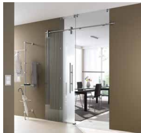
Glasschiebeanlage Typ 1 | Schiebesystem: Edition Style, Edelstahl Chrom Glanz poliert, Seitenteil und Oberlicht: Float hell | Glasdesign: Stream Typ 1, Motiv matt/Fläche klar Griffstange: L&H G 700 rund, Griffleiste einseitig, Edelstahl Chrom Glanz poliert