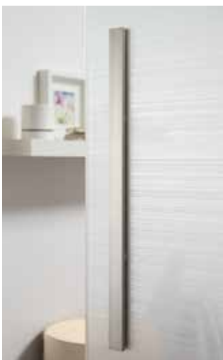
Glasdesign: Corteo | L&H Griffleiste beidseitig, 600 mm, ähnl. Edelstahl matt