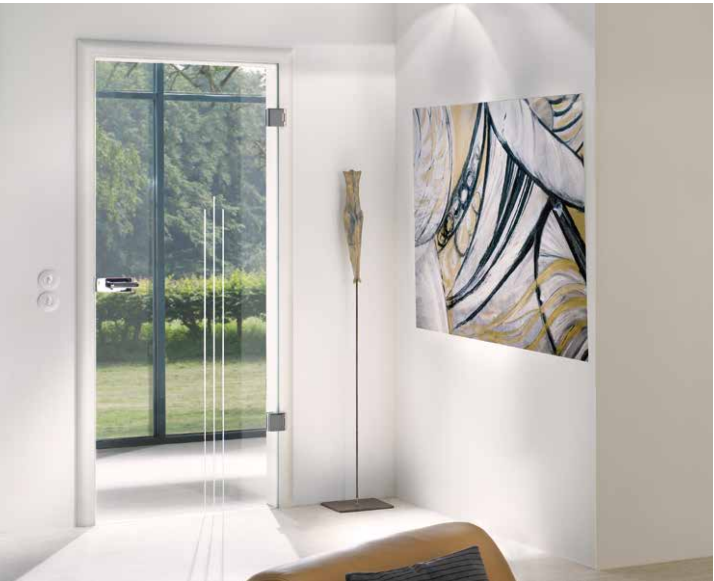
Drehtür 1-flg. | Glasdesign: Dante, Motiv matt / Fläche klar, auch als VSG-Tür | Beschlagset: Pure 2.0, ähnl. Chrom Glanz