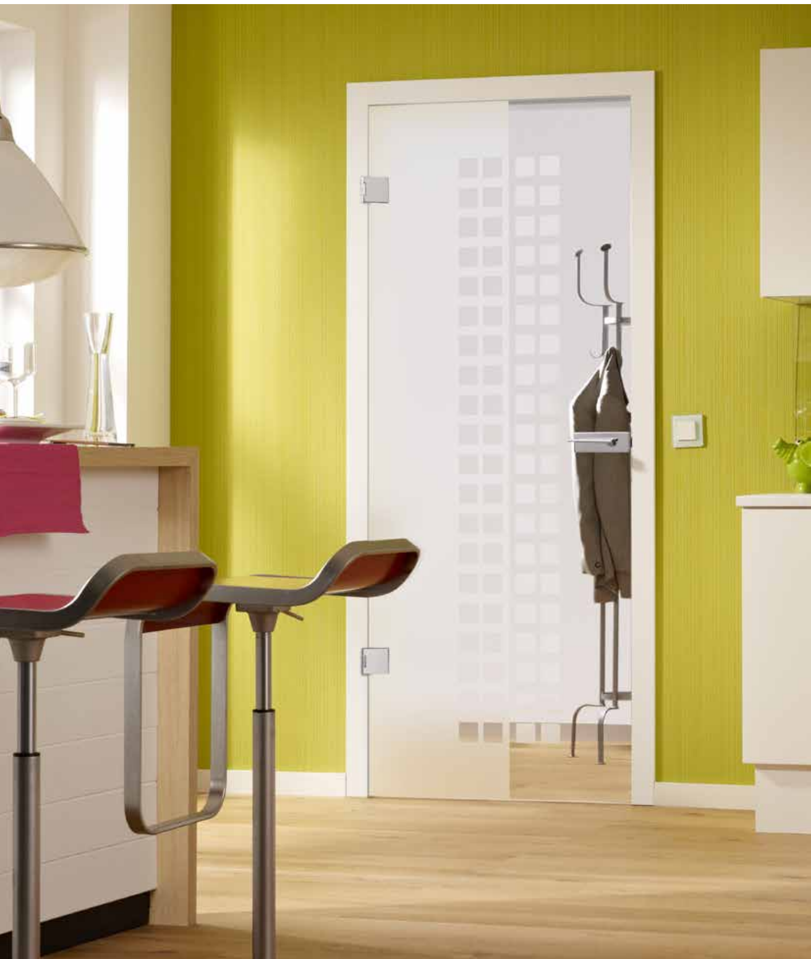
Drehtür 1-flg. | Glasdesign: Casandra, Motiv matt/Fläche klar | Beschlagset: Square 2.0, ähnl. Chrom Glanz