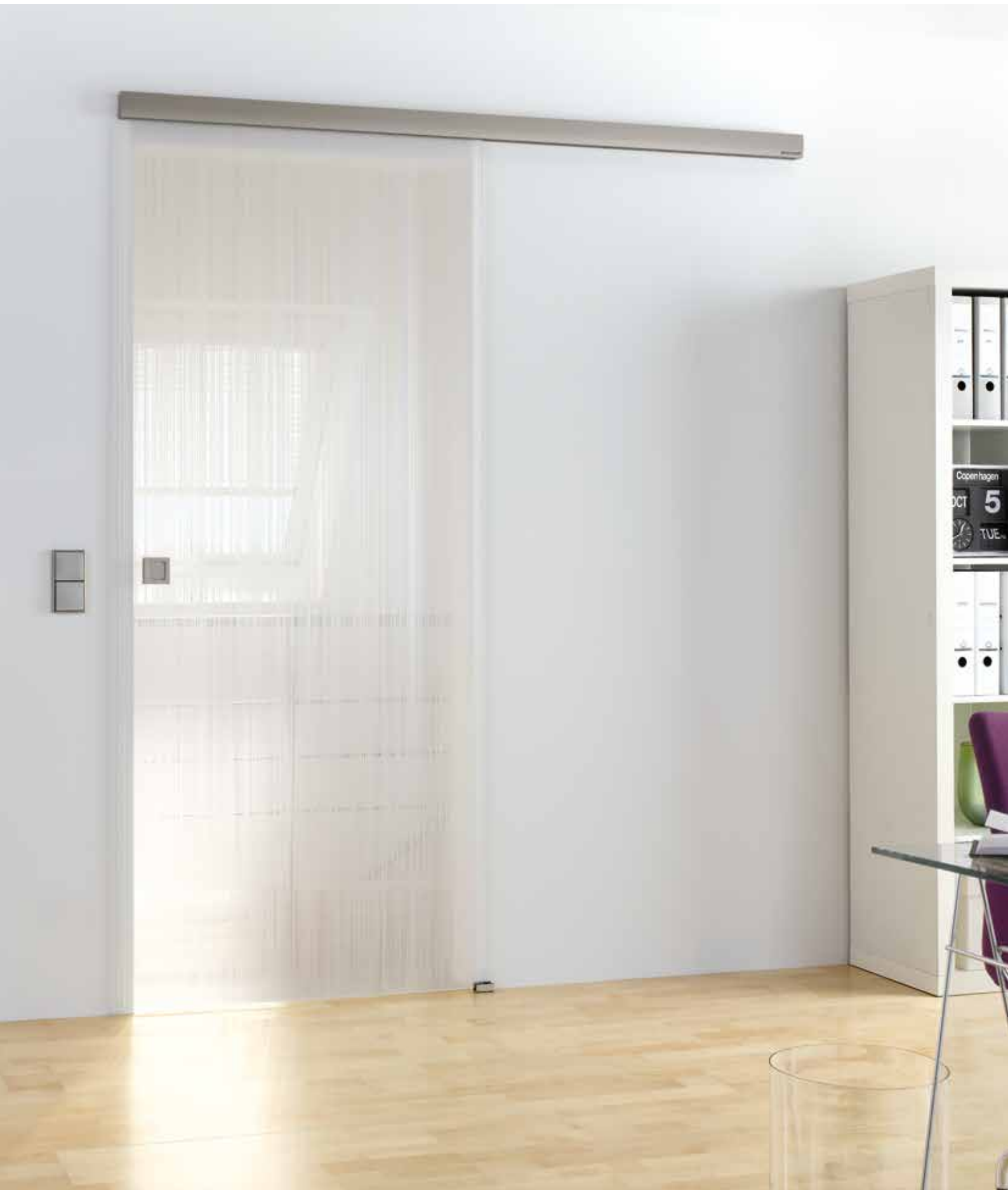
Schiebesystem 1-flg.: Tvin 2.0 Convex, ähnl. Edelstahl matt | Glasdesign: Lista Due, Motiv beidseitig satiniert, 3D-Optik | Griffmuschel: L&H M 60, ähnl. Edelstahl matt