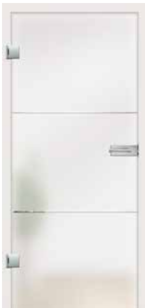
Fenea, V-Rillenschliff poliert auf Satinato