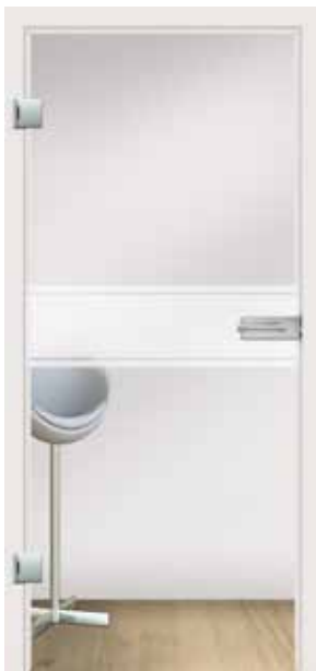
Typ 127, Motiv matt / Fläche klar