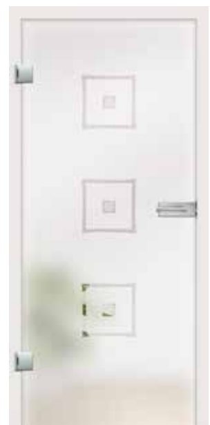
Alana, Motiv klar/Fläche matt auch als Glasschiebetür und VSG-Tür