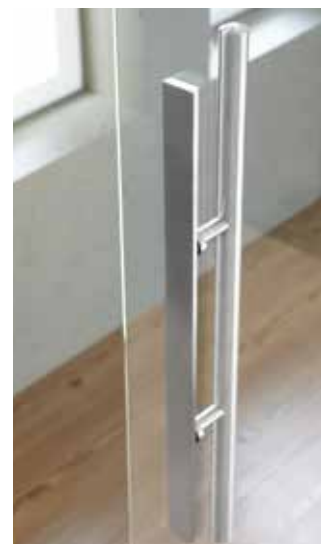
Rückansicht: L&H G 700 rund, Griffleiste einseitig, Edelstahl matt