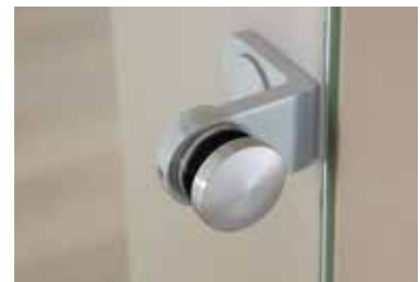
Punkthalter: Edition Style und Tvin 2.0/120 Edelstahl matt