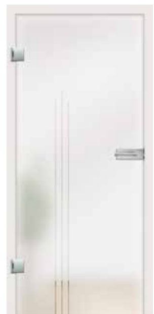
Dante, Motiv klar / Fläche matt auch als VSG-Tür