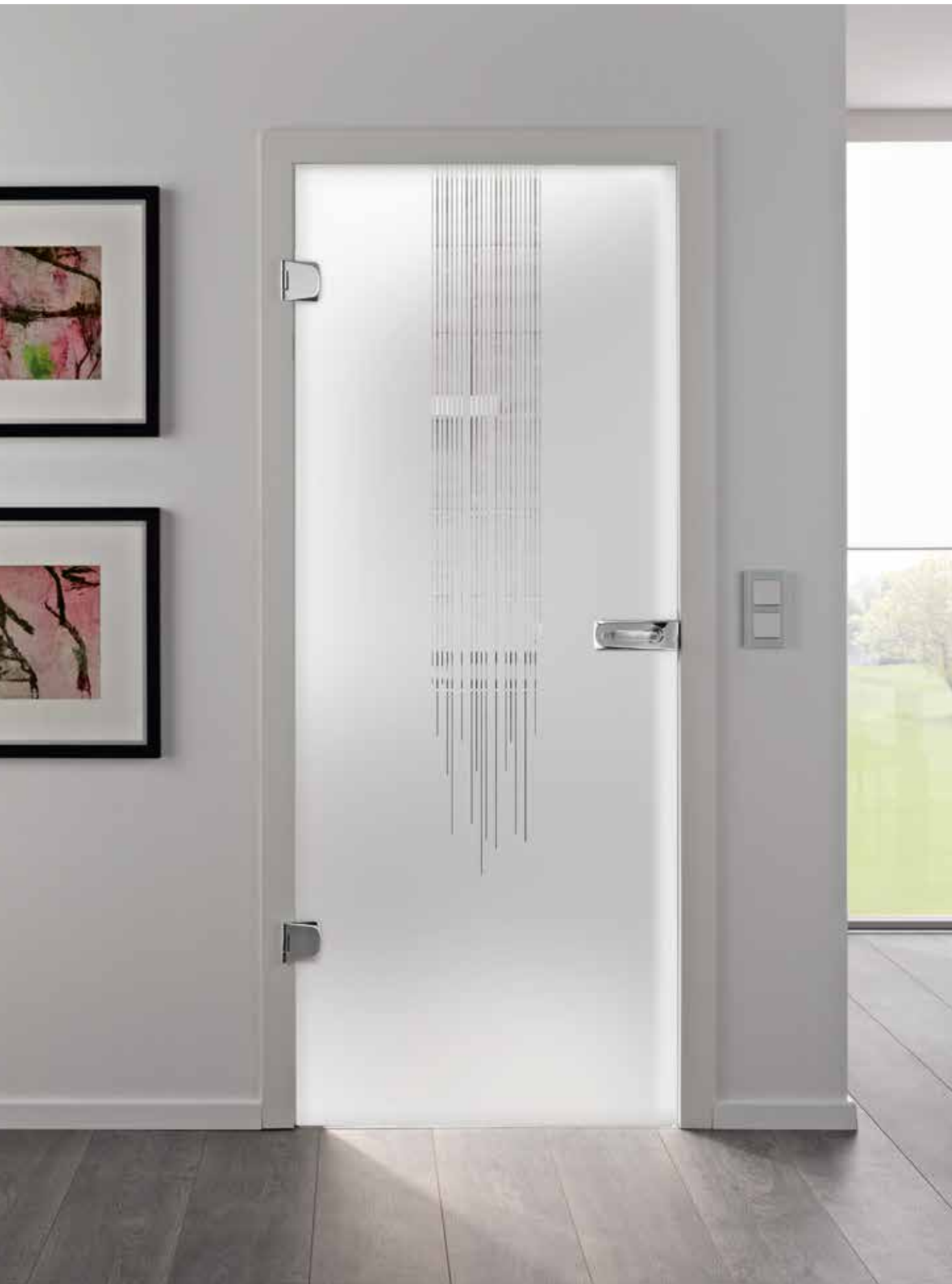
Drehtür 1-flg. | Glasdesign: Flow, Motiv klar/Fläche matt, auch als Glasschiebetür | Beschlagset: Bacio 2.0, ähnl. Chrom Glanz