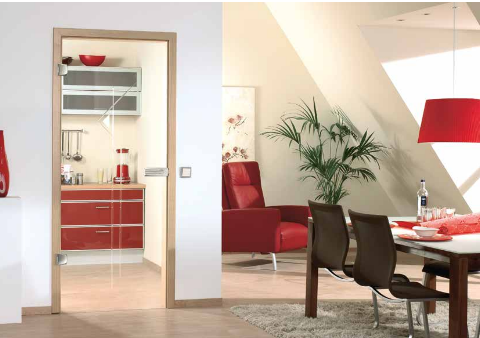
Drehtür 1-flg. | Glasdesign: Palatino, V-Rillenschliff poliert mit Satinierung auf Float hell | Beschlagset: Bacio 2.0, ähnl. Edelstahl matt