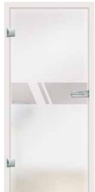
Aero, Motiv klar / Fläche matt auch als VSG-Tür