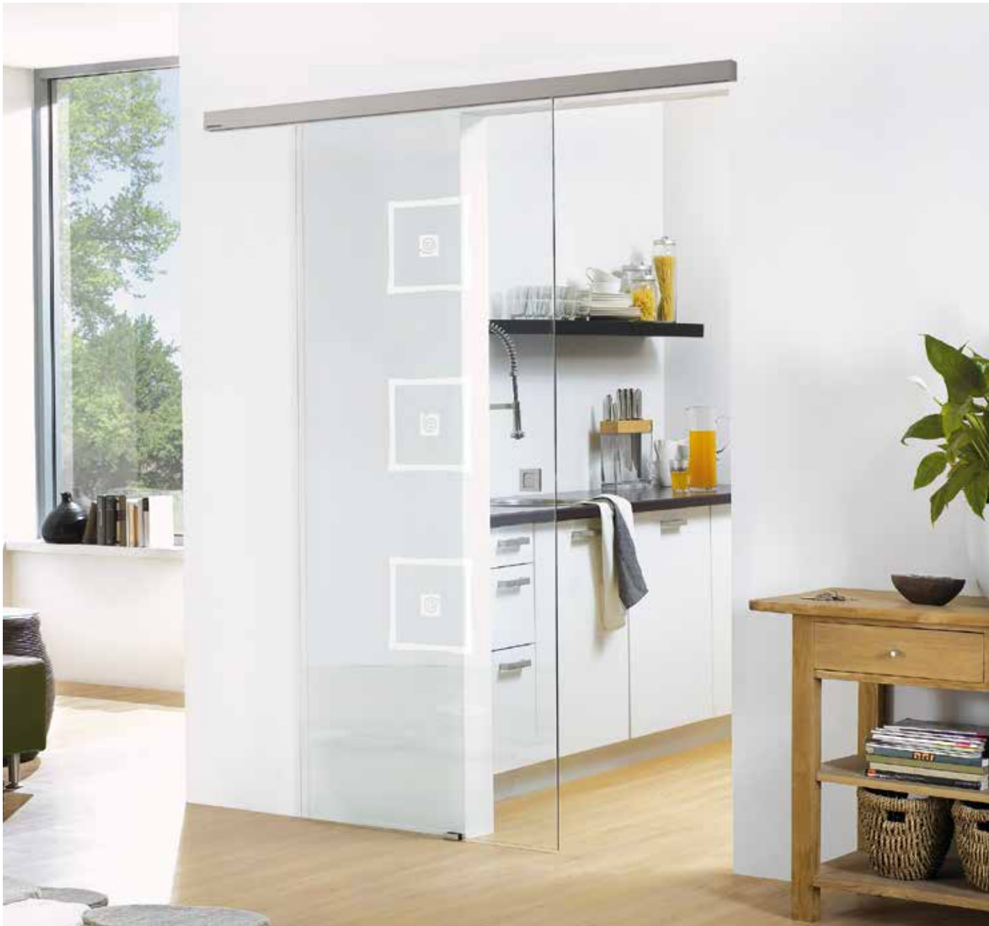
Schiebesystem 1-flg.: Tvin 2.0, ähnl. Edelstahl matt | Glasdesign: Alana, Motiv matt/Fläche klar | Griffmuschel: L&H M 60, ähnl. Edelstahl matt