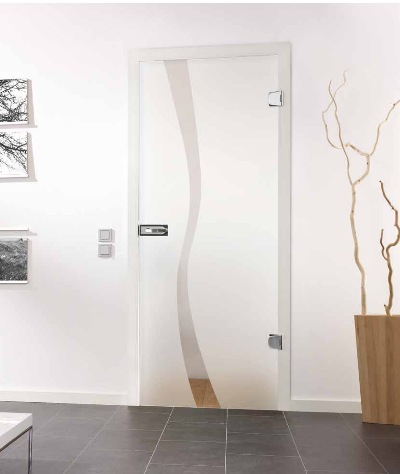
Drehtür 1-fig. | Glasdesign: Wave Typ 8, Motiv klar/Fläche matt, auch als Glasschiebetür und VSG-Tür | Beschlagset: Vista Due 2.0, ähnl. Chrom Glanz mit Inlay, weiß RAL 9010