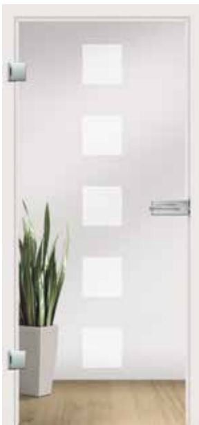
Flair, Motiv matt/Fläche klar