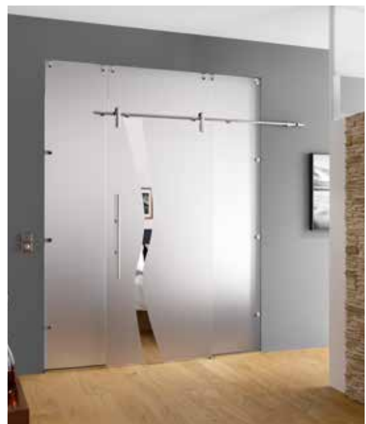
Glasschiebeanlage Typ 2 | Schiebesystem: Edition Style, Edelstahl Chrom Glanz poliert, Seitenteil u. Oberlicht: Satinato | Glasdesign: Wave Typ 8, Motiv klar/Fläche matt | Griffstange: L&H G 700 rund, Edelstahl Chrom Glanz poliert