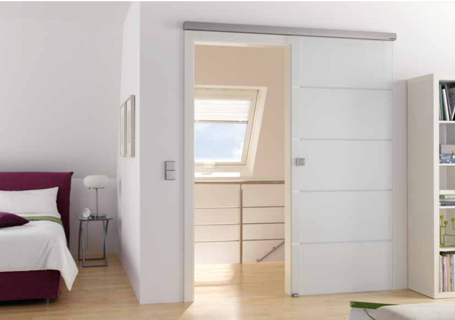
Schiebesystem 1-flg.: Tvin 2.0 Convex, ähnl. Edelstahl matt, Wand-Montage vor Zarge | Glasdesign: Atos, Streifen klar/Fläche matt | Griffmuschel: L&H M 60, ähnl. Edelstahl matt