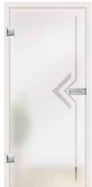
Palia, Motiv klar/Fläche matt