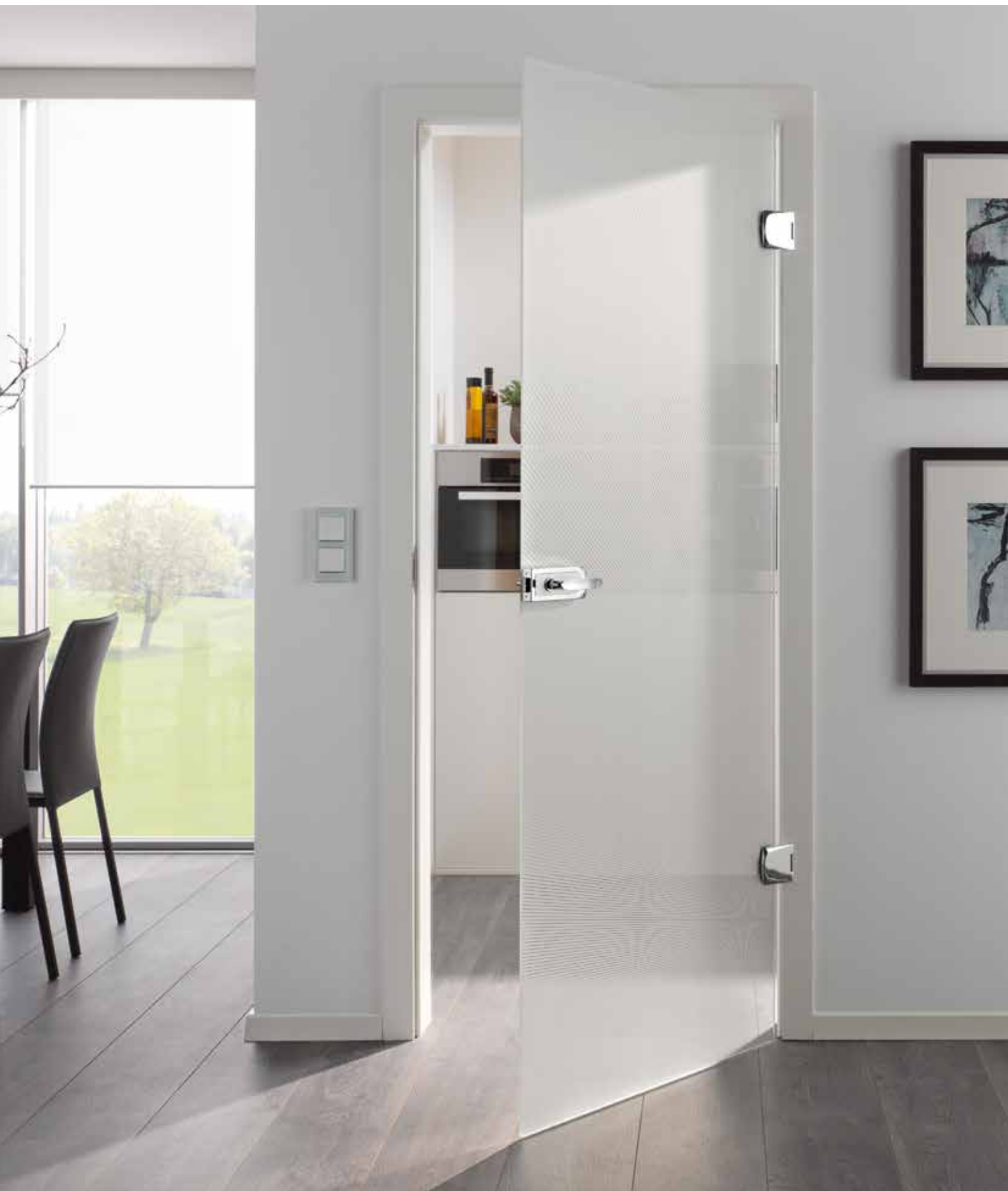
Drehtür 1-flg. | Glasdesign: Lucido | Beschlagset: Vista Due 2.0, ähnl. Chrom Glanz mit Inlay, weiß RAL 9010