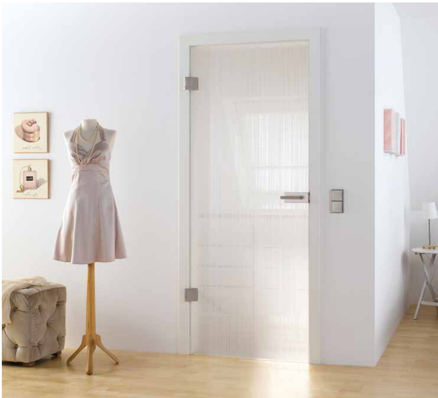
Drehtür 1-fig. | Glasdesign: Lista Due, Motiv beidseitig satiniert, 3D-Optik | Beschlagset: Square 2.0, ähnl. Edelstahl matt