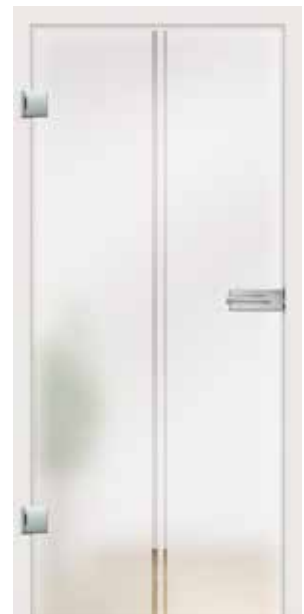
Piano, Motiv klar/Fläche matt