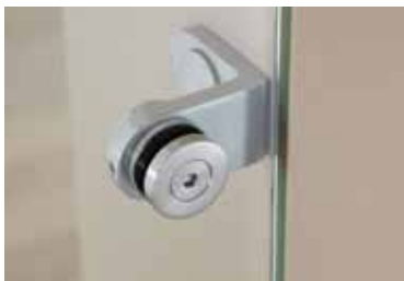
Punkthalter: Edition Basic Edelstahl matt