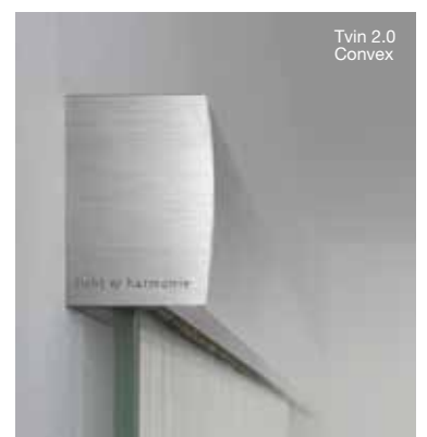
Tvin 2.0 Convex