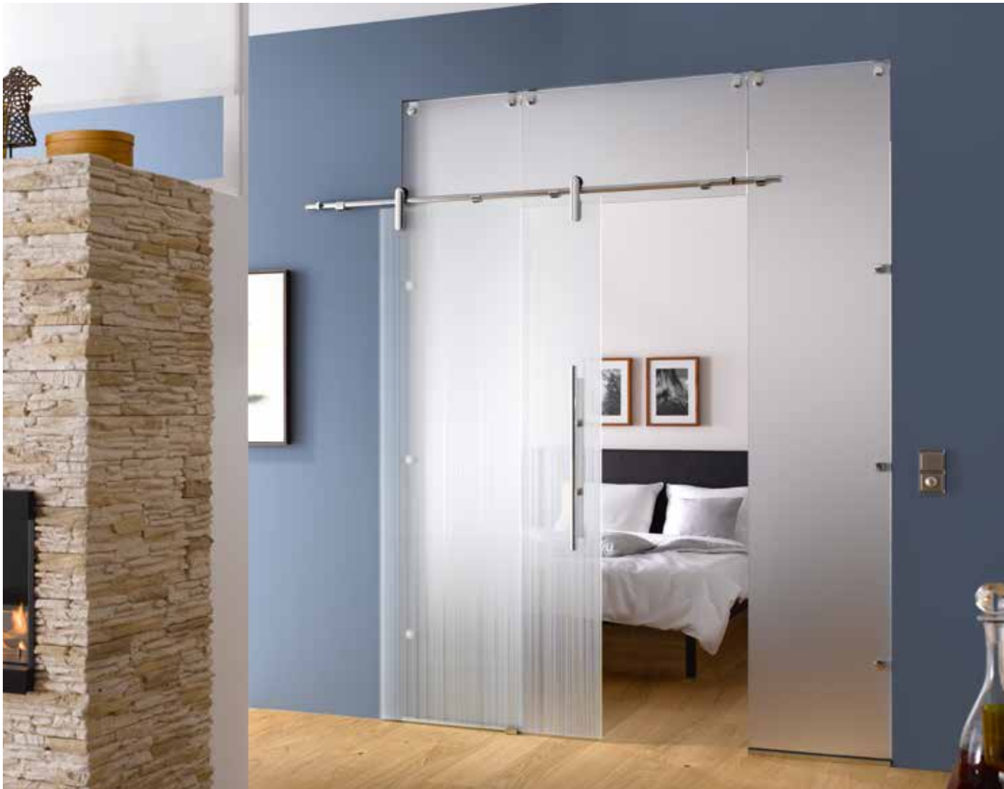
Glasschiebeanlage Typ 2 | Schiebesystem: Edition Style, Edelstahl Chrom Glanz poliert, Seitenteil und Oberlicht: Satinato Glasdesign: Lista Due, Motiv beidseitig satiniert, 3D-Optik | Griffstange: L&H G 700 rund, Griffleiste einseitig, Edelstahl Chrom Glanz poliert