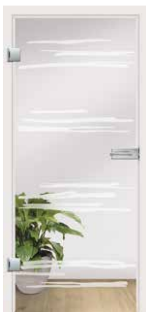
Gemini, Motiv matt / Fläche klar auch als Glasschiebetür und VSG-Tür